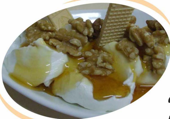
Griechischer Joghurt mit Honig und Walnüssen